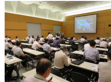
みやぎ生産改善事例発表会