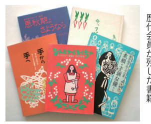
▲活動を伝えるために歴代会員が残した書籍