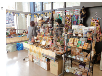
定期的な開催でファンも多い アマニ・ヤ・アフリカ▶

申込みや使用にあたっての注意点等の詳細は、 みやぎ NPO 情報ネットをご覧ください。