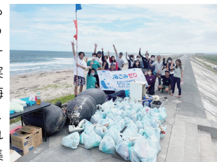
▲1時間で多くの海ごみを回収

10ヶ所に391人が参加し、1時間で1048kgものごみが集まった今回のビーチクリーン。カキ養殖で使うプラスチック製の漁具「豆管(まめかん)」は、1万1636個も見つかったそうです。このビーチクリーンを実施したみやぎ海岸美化協議会は、「短い時間でこれだけの量が集まったことに驚いている。宮城の海岸の現状を変えるには、この活動の輪をもっと広げなければならない」と言います。すでに、菖蒲田海水浴場(七ヶ浜町)と日門漁港(気仙沼市)には、誰でも使えるトンゴやゴミ袋を収めるビーチクリーンBOXを設置しています。今後は、このBOXの設置場所を増やしていく計画です。