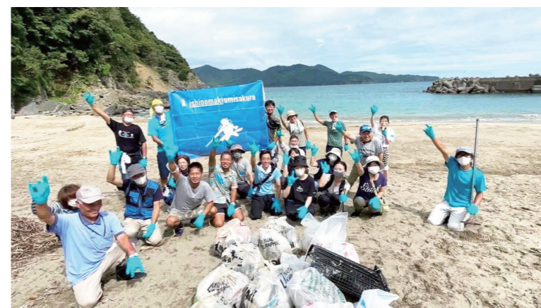
▲市民も参加し地元の海岸を清掃

2050年には、魚より海洋ごみの量が多くなると言われています。ビーチクリーンに参加して、未来の海づくりに貢献しませんか。