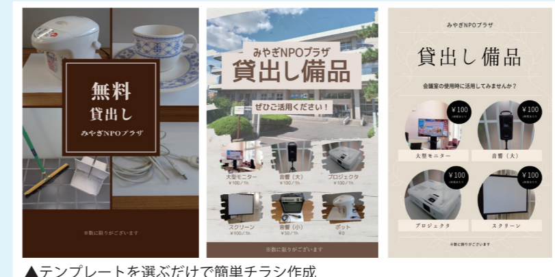
▲テンプレートを選ぶだけで簡単チラシ作成

インターネット上のフリー素材を組み合わせでデザインをするのもいいのですが、ダウンロードした画像がぼやけてしまったり、配置に悩んでしまったりと意外と難しいものです。Canvaでは、デザインされたテンプレートを使用するので、悩むことなく作業することができます。作成したスタッフも「思ったより簡単にできた。難しい作業がなく、誰でもデザイン性の高いチラシを作ることができる」と満足した様子。テンプレートが豊富で、選ぶのに迷うほどだそうです。