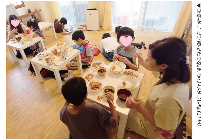
◀食事をしたり遊んだり好きなことをして過ごせる

親の会では切実な悩みが聞かれます。特に小学校低学年で不登校になると、日中一人で安全に過ごすことは困難です。周りに面倒を見られる人がいなければ親は仕事をやめざるを得ません。さらに平日の日中に子どもと外出すれば「学校は？」と声をかけられ「子どもは学校にいるのが当たり前」という目に苦しみ、社会から孤立していきます。子どもも「親を苦しめる自分はダメな人間だ」と自己嫌悪に苛まれ、親子で負のスパイラルに陥ってしまうのです。そこで悩みを抱える親たちが運営ボランティアとなり、仙台市内にフリースクール「ふふふる〜む」を開設。子どもは思い思いに過ごし、親同士の支え合いの場にもなっています。