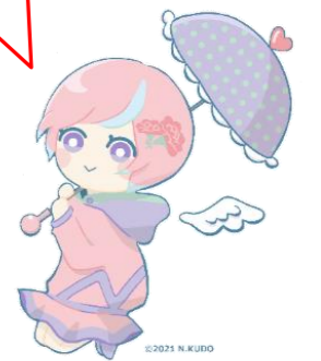
川内沢ダムイメージキャラクター「川内あい」