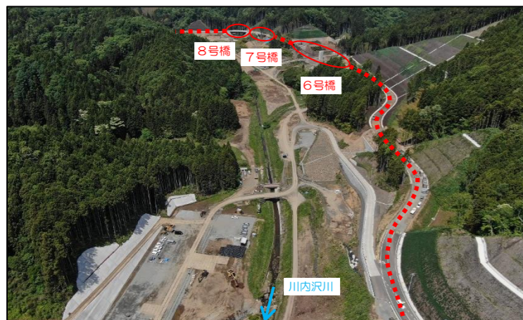
付替道路全景(ダム建設位置~8号橋)