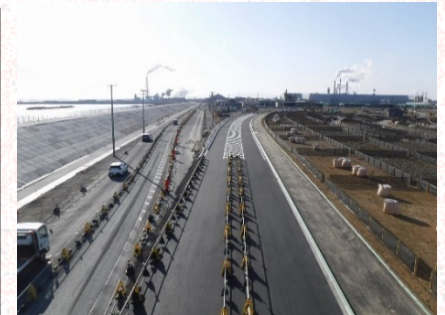
①石巻港方面を望む