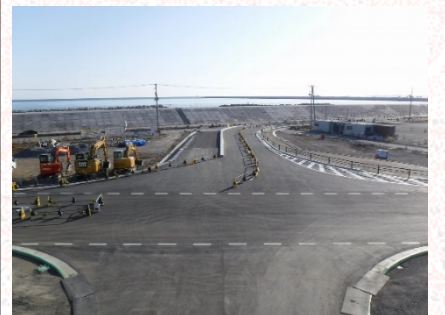
②交差点部から南方面を望む