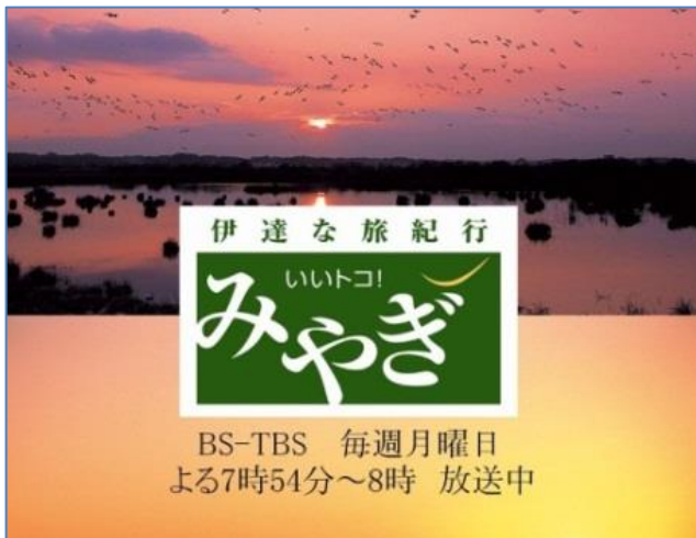
(広告画像のイメージ)