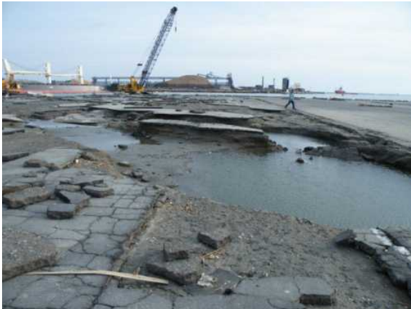
< 3月16日撮影 >