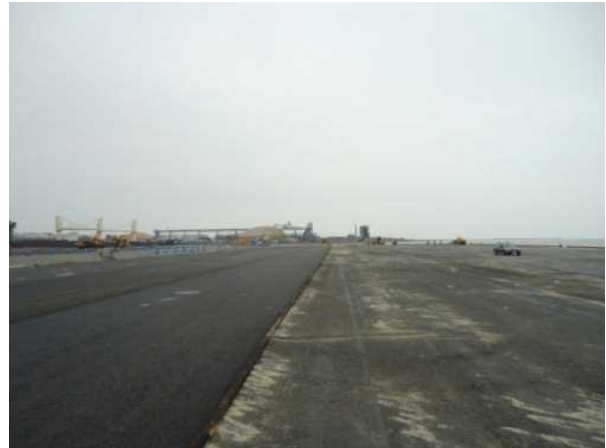
< 6月2日撮影 >