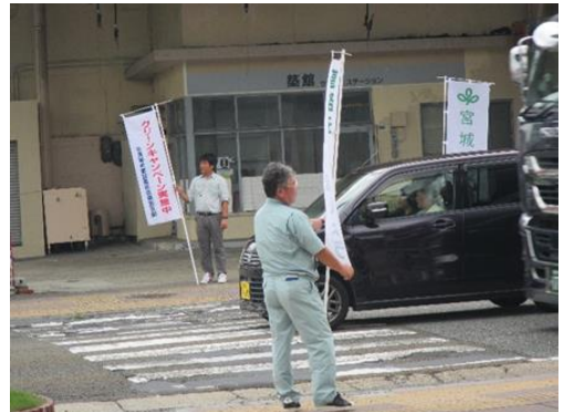
[スマイルサポーター]

県では、県が管理する道路や河川の清掃・除草・除雪・緑化などの美化活動を定期的に行い、良好な環境づくりに積極的に取り組むボランティアをスマイルサポーターとして認定しています。