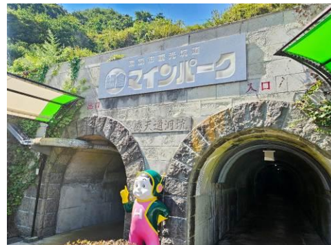
細倉マインパーク