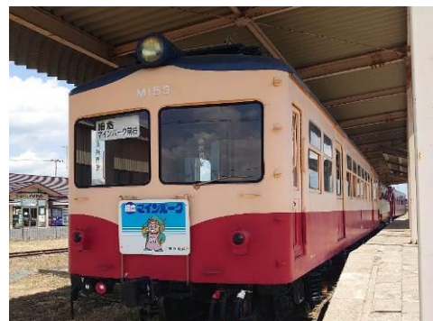
くりでんミュージアム