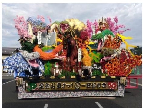
くりこま山車まつり