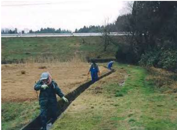
開水路における機能診断の実施状況