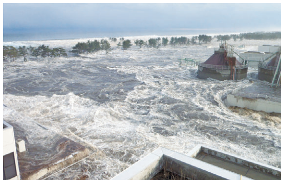
岩沼市下野郷 防潮林を越える津波