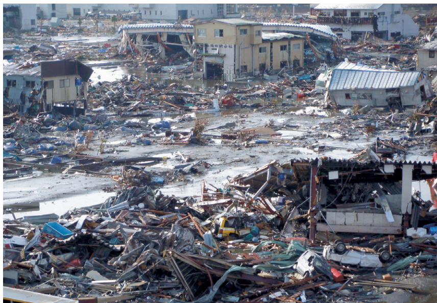
3月12日 気仙沼市朝日町