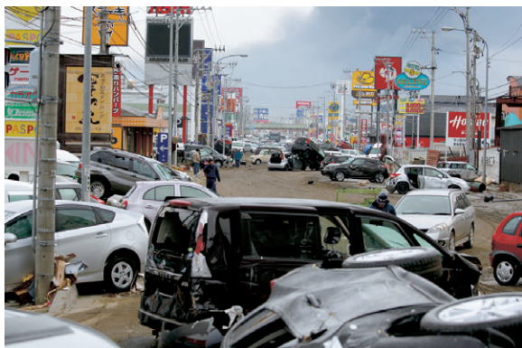
3月13日 多賀城市八幡町前（自衛隊）