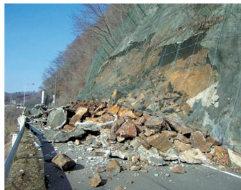
川崎町大字支倉地内 道路のり面の崩落 (川崎町)