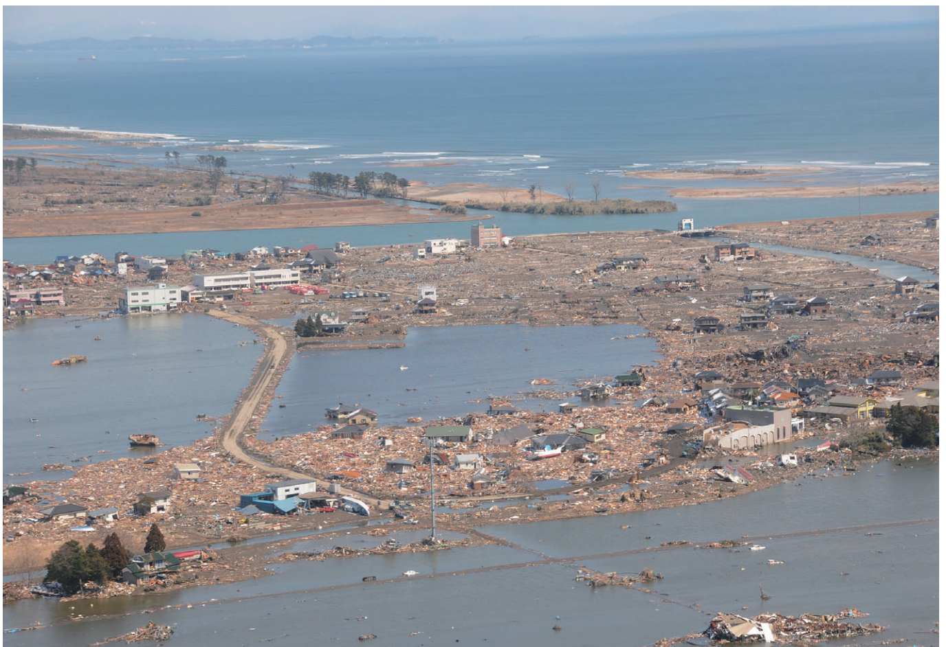
名取市関上（名取市）