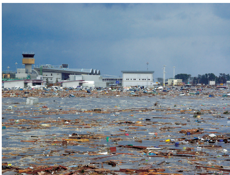
がれきに覆われた仙台空港