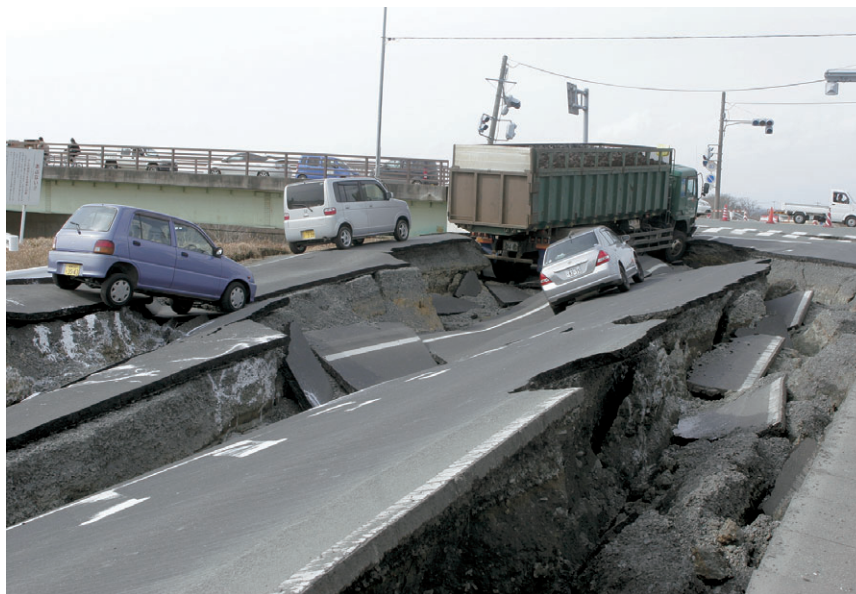
3月11日 大崎市古川江合橋付近 崩落する道路 (大崎市)