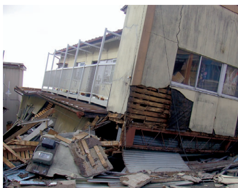
3月18日 登米市迫町 建物の倒壊