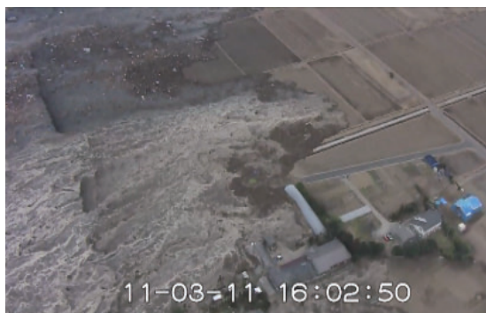
名取市上空 仙台平野を襲う津波