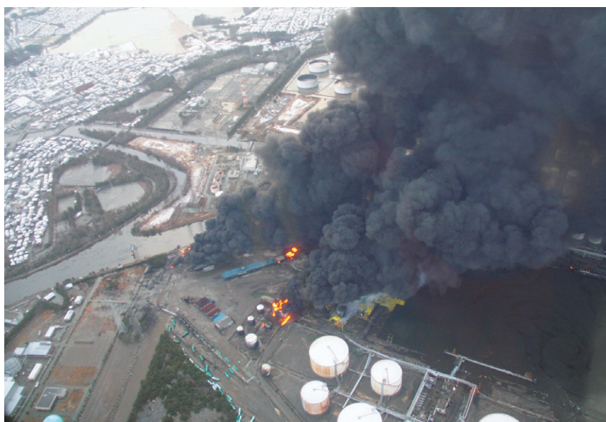
3月11日 黒煙を上げるJX日鉱日石仙台タンク