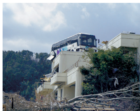
3月18日 津波により雄勝公民館の屋上に乗り上げたバス (石巻市)