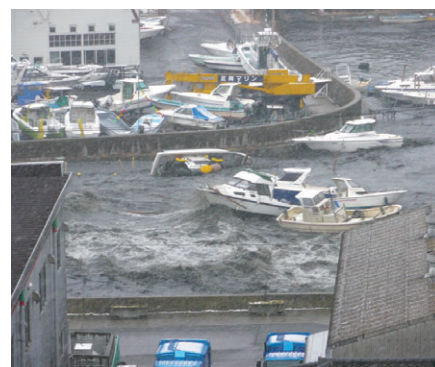
塩竈市 貞山運河に流入する津波