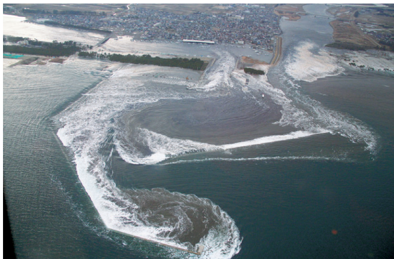
名取市関上漁港へ流入する津波