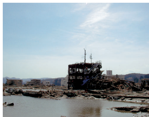
3月14日 南三陸町防災庁舎