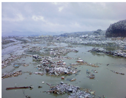
3月11日 津波襲来後の南三陸町