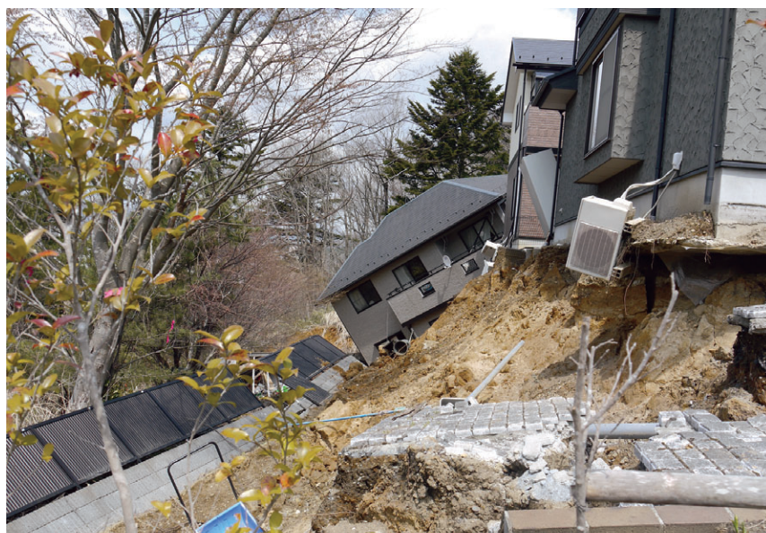
仙台市青葉区西花苑 丘陵部の宅地被害(仙台市)