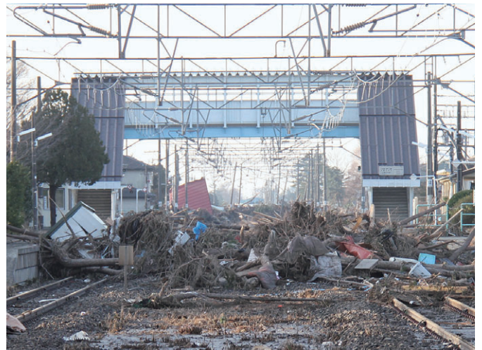
3月14日 がれきに覆われたJR浜吉田駅（巨理町）