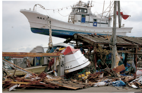
3月17日 津波により建物の上に乗上げた船（七ヶ浜町）