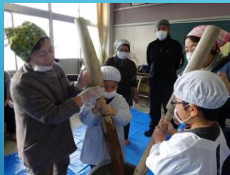
協力者 おじいさん おばあさん