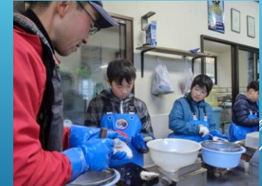
協力者 漁協青年部