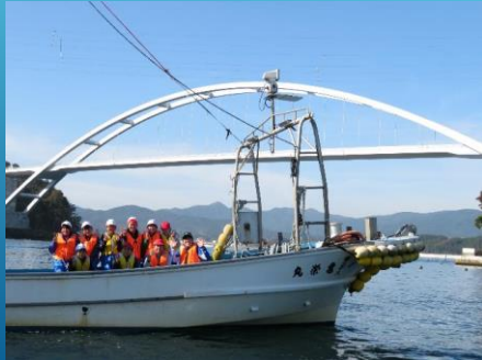
気仙沼市立大島小学校