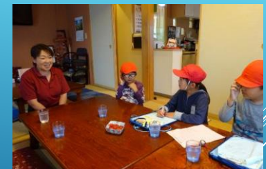
協力者 読み聞かせボランティア 島内商店・施設