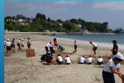
気仙沼市立大島小学校