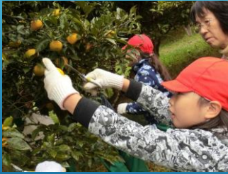
協力者 ユズ農家の方 大島ソバさろんの会