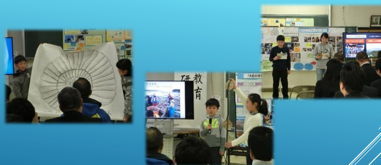
1. 28 第3回大島小学校海洋教育発表会・研修会