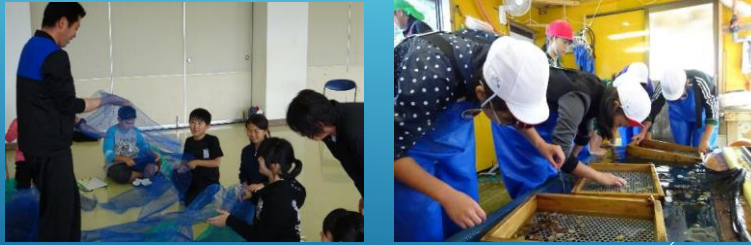
協力者 漁協青年部