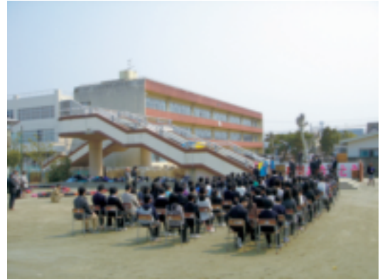
石巻市立蛇田小学校の校庭で行われた卒業式の様子

最も早いところでは4月11日に、それ以外においても4月下旬には多くの学校で入学式・始業式が実施され、新学期を迎えることとなった。しかし、石巻市立の小中学校5校、県立高等学校7校においては、4月下旬に行われた入学式・始業式の後、再度臨時休校の措置がとられ、5月9日から授業が開始されることとなった。