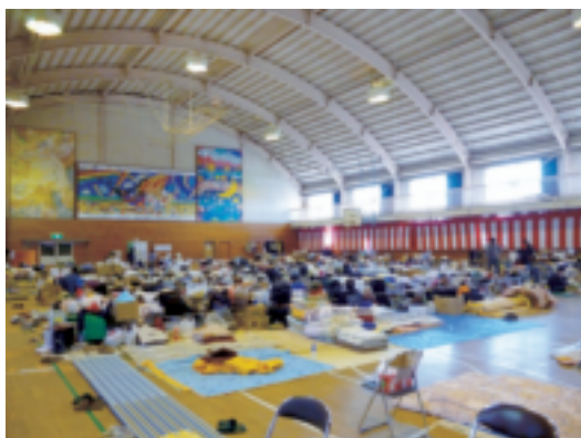
避難所として使用された学校体育館

実際に避難所として利用された学校の65%で、避難所運営マニュアルが整備されておらず、教職員が避難所の運営にどのように関わるのかが明確でなかったため、その対応が困難となる状況も見られたが、避難者である地域住民の協力を得て、円滑に運営された例もあった。また、指定避難所となっていない学校には物資等の備蓄がなく、指定避難所であっても備蓄品の保管場所が学校以外の場所であったため、学校にある数少ない備品や物資で対応したり、近隣住民や商店等からの支援により対応した学校もあった。しかし、備蓄品があっても、何千人もの避難者に対し、その量が絶対的に不足する状況も発生していた 9 。