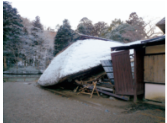
有備館の被災状況(大崎市)

災害復旧事業については、指定文化財所有者や指定無形文化財の保護団体や国登録文化財所有者等が実施する修理・修復や再生事業に対して、適切な保存・保護のための指導・助言を行うとともに、経費を補助し被災文化財の早期復旧を図った。平成23年度には、国宝瑞巖寺庫裏など国指定文化財18件、補陀寺六角堂など県指定文化財7件の災害復旧事業に対して助成し、また、国・県・市町村指定、国登録文化財の修復にかかる個人・法人の所有者負担に対しては、東日本大震災復興基金を運用して国登録文化財1件に対し助成を行った。