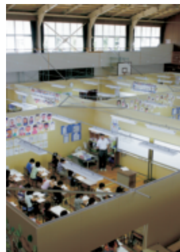
パーティションで仕切られた 体育館での授業の様子（大崎市）

児童生徒の生活環境が大きく変化する中、児童生徒の学力の維持・向上対策が課題となっており、また、校庭への応急仮設住宅の建設等による、遊び場や運動する機会の減少等による体力の低下も懸念されている。