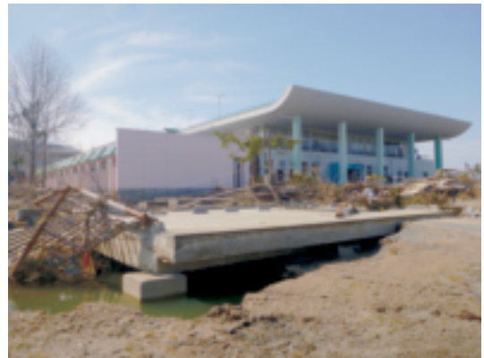
被災（本館前が地盤沈下）した松島自然の家

県有施設については、松島自然の家では津波により施設全体が壊滅的被害を受けたため、事務所機能を東松島高校第2体育館に移転し、主に出前講座を中心に事業を展開した。その後、キャンプ等自然体験の活動フィールドを求めて平成24年4月1日から東松島市の鷹来の森運動公園に移転した。また、蔵王自然の家は5月6日から、志津川自然の家は、発災から8月23日まで避難所として使用され、避難者が応急仮設住宅等へ移動した後、9月1日から事業を再開した。宮城県美術館では天井材等の脱落防止措置等の内外装の補修工事が平成24年3月27日に完了した。併設の佐藤忠良