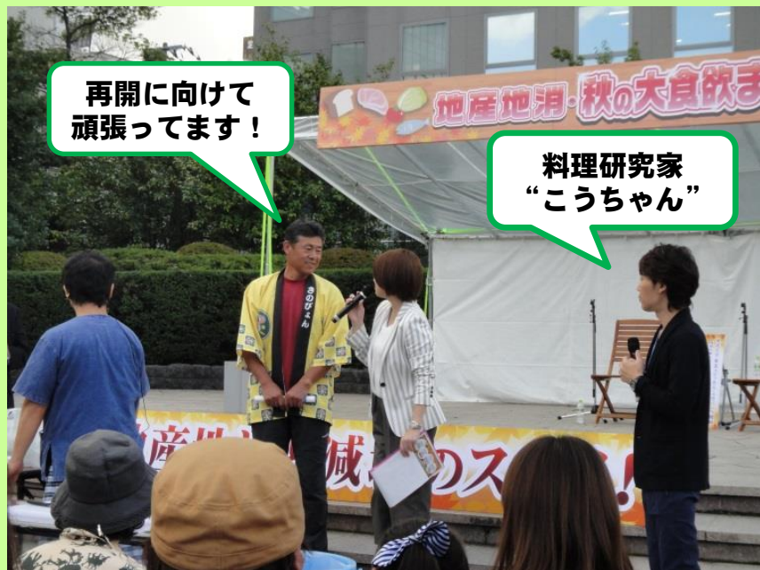
ライブクッキング