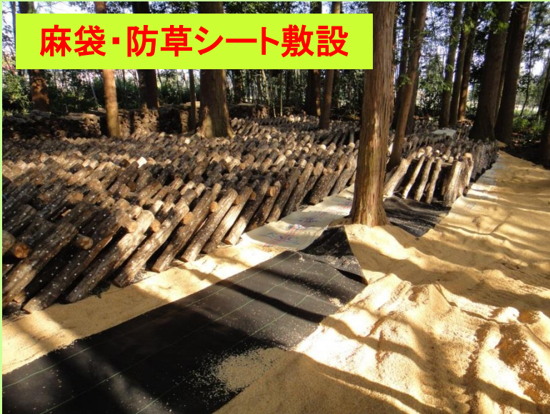
麻袋・防草シート敷設