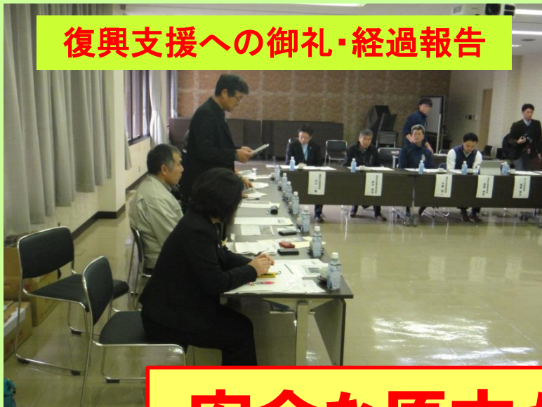
復興支援への御礼・経過報告