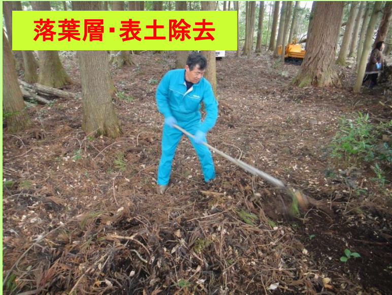
落葉層・表土除去