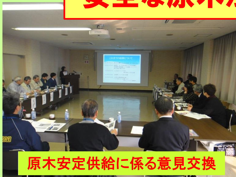
原木安定供給に係る意見交換