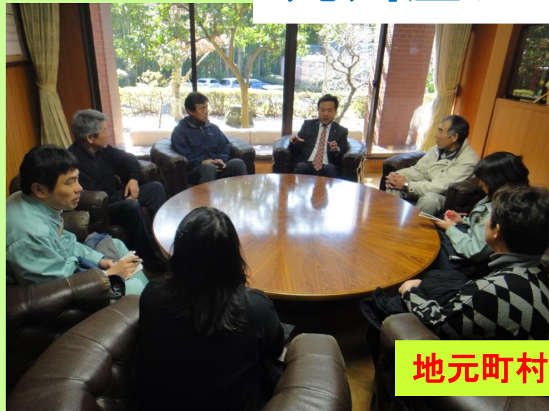
地元町村長へのあいさつ