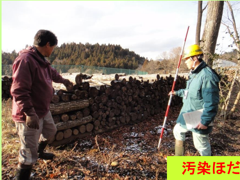
汚染ほだ木の撤去・集積