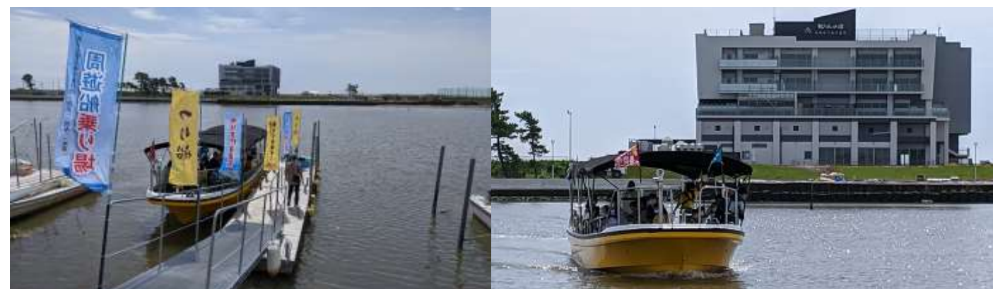
《ゆりあげ船まつりについて》

開催日：令和3年11月21日（日）、23日（火・祝）、28日（日）の3日間 船舶：ゆりあげ丸（ コース）・他2艇