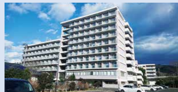
下愛子県職員寮(仙台市青葉区)

世帯用の職員住宅や独身・単身用の職員寮が県内各地に設置され、生活の拠点として利用されています。