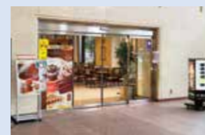
県庁1階カフェラウンジ