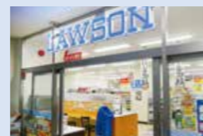
県庁2階コンビニエンスストア