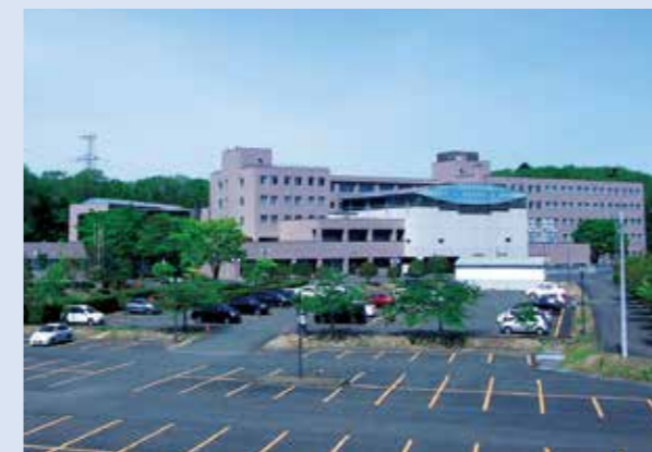
公務研修所(東北自治総合研修センター内)

自主的な能力開発機会の提供として、eラーニング研修の実施や通信講座を開設し、受講支援を行っています。