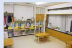
みやぎっこ保育園