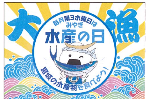
みやぎ水産の日ポスターイメージ

(塩竈市) 11月19日(水)に市内のみやぎ生協、ヤマザワなど量販店において、「みやぎ水産の日」キャンペーンイベントの実施。