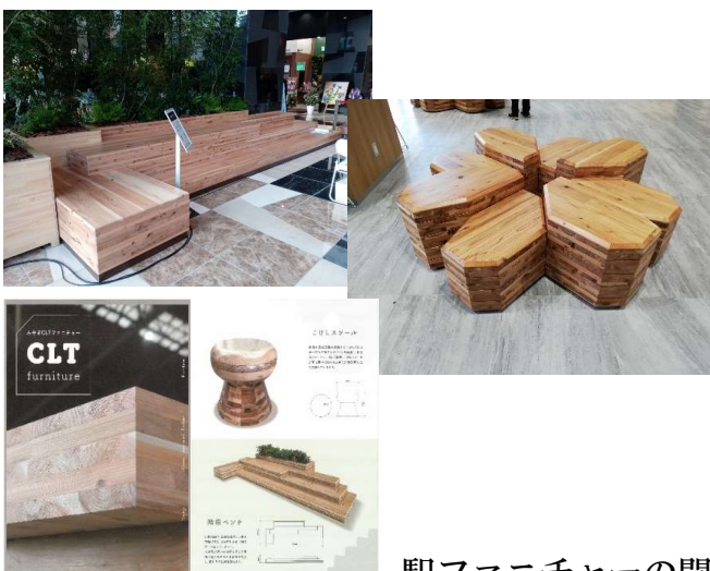
駅ファニチャーの開発