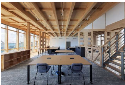
【事例2】東北ボーリング株式会社（事務所） 在来軸組工法+CLT CLTを2F床と屋根に活用