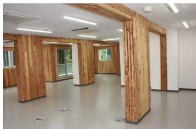
【事例1】株式会社コスモスウェブ（事務所） CLTパネル工法（ルート2） 県内初の3階建CLT建築

応募書類 【提案書】（事務取扱要領様式10、11、12）※宮城県HPより取得ください 【添付書類】施設概要図（イメージパース等）設計図（位置図・平面図・矩計図等） 事業費積算資料 など