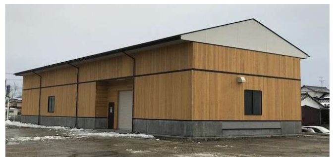
ユニット化した倉庫の開発