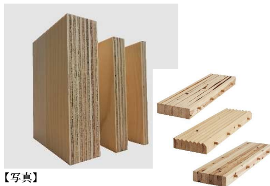
【写真】 （左）超厚合板（右）DLT