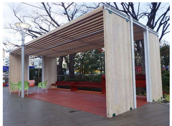
ユニット化した公園施設の開発