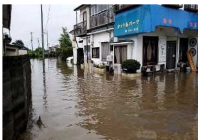
美女川越水による浸水被害 (美里町中塚字夕時地内ほか)