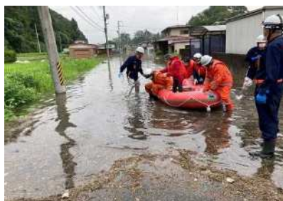
出来川越水による救助活動 (美里町北浦字姥ヶ沢地内)