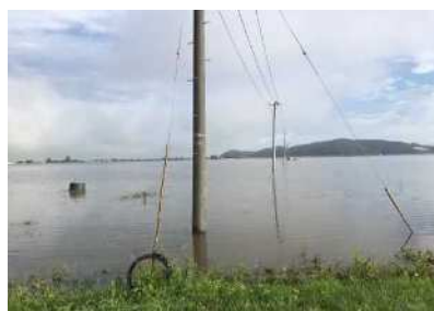
出来川決壊・越水による浸水被害 (美里町練牛字植尻地内ほか)