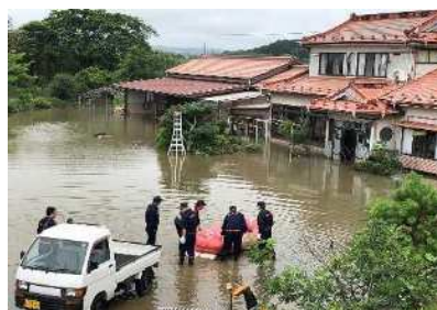
出来川決壊による救助活動 (美里町字鳥谷坂地内)