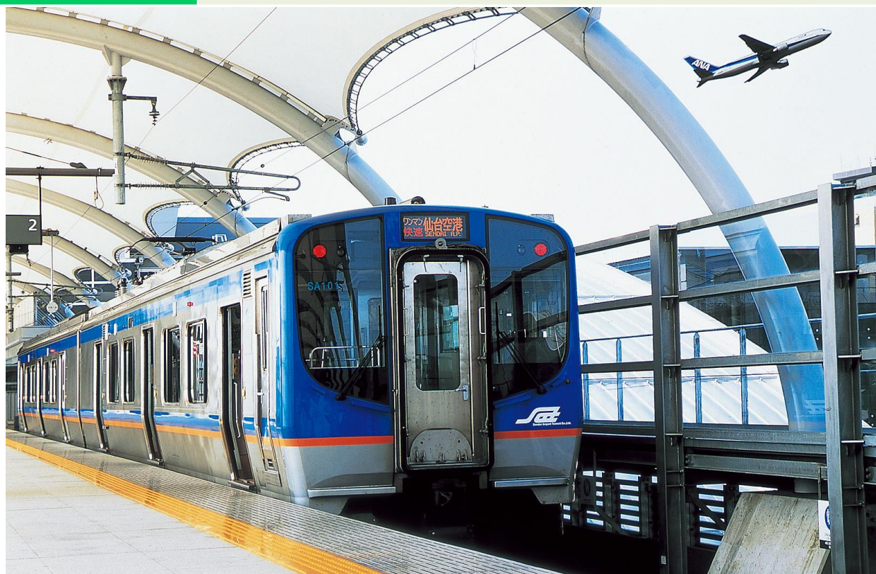
仙台空港アクセス鉄道