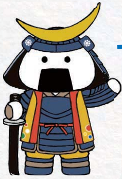
仙台・宮城 観光PRキャラクター むすび丸