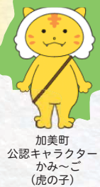
加美町 公認キャラクター かみ〜こ (虎の子)

学校と地域が 一丸となって これからの社会に 直結した 魅力ある教育活動を 実現します