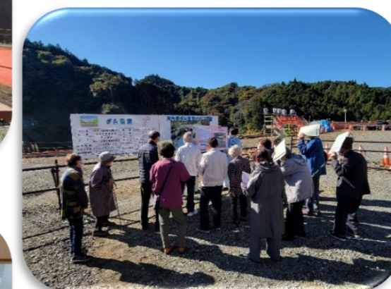
愛島北目地区老人会の見学状況