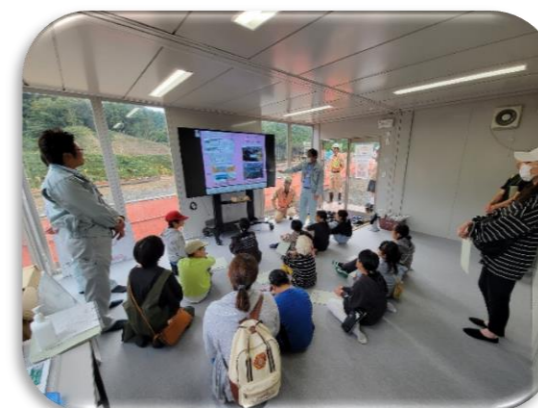
高館公民館「わくわくチャレンジ」の状況①