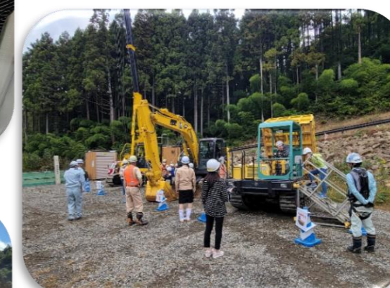
高館公民館「わくわくチャレンジ」の状況②