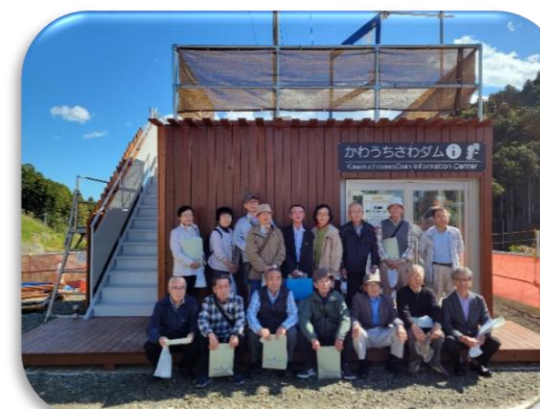
名取市職員OB会の見学状況