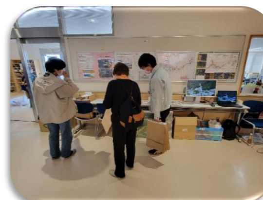
名取市愛島公民館まつりの展示状況①