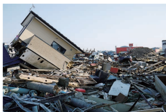
令和元年東日本台風