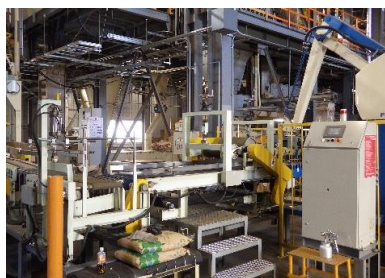
ペレット製造工場