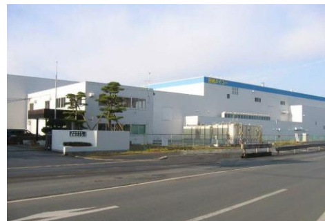
株式会社山形メイコー 石巻工場