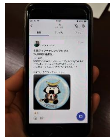
貸与スマホで情報共有 ※一部加工しております

「歩数アップチャレンジ」や「けんこうクイズ!塩eco&受動喫煙zero」のような事業への参加も、この地域の一員として、安全衛生委員会で協議して決まりました。