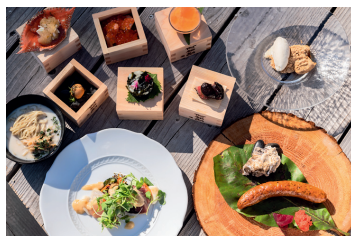
前期で提供された 三浦将尋×佐藤強の料理

チケット 当日（一般）／3500円（学生）／3000円 前売り（一般）／3000円（学生）／2500円 宮城県民パスポート／2000円 中学生以下、障害者手帳をお持ちの方／無料 ※前売り券販売中 8月19日（金）まで ※詳細は公式サイトにてご確認ください