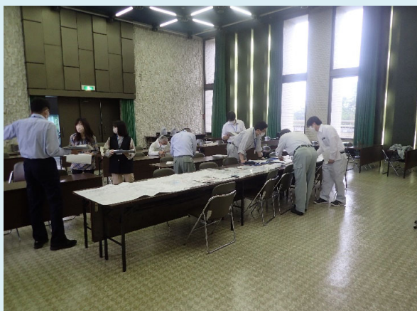
3階大会議室での訓練の様子(垂直避難後)