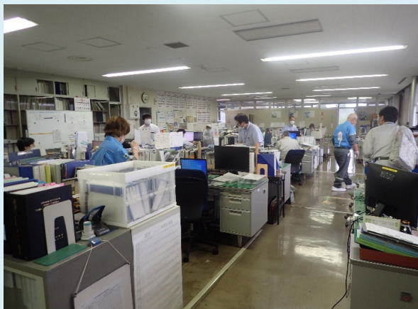
発災直後の2階事務室の様子