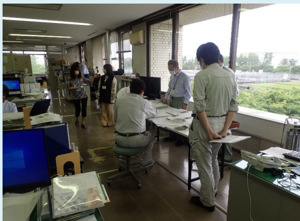
2階事務室での訓練の様子(大津波警報解除後)