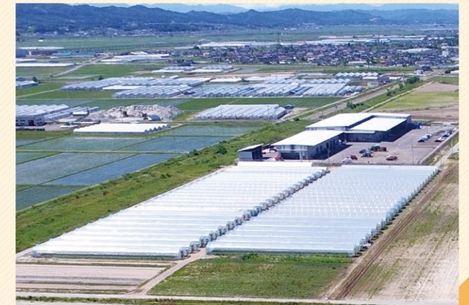
震災後に立ち上がった法人による大規模園芸拠点(山元町)

大区画ほ場整備により新たに立ち上がった経営体が、先進的技術を取り入れ、イチゴ・トマトなどの大規模園芸栽培を行い、雇用創出、関係機関等との連携によって地域農業を支え、県内の園芸振興の促進を図ります。