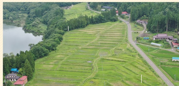
日向地区 整備事業前

震災以降は沿岸部の復旧・復興を優先してきましたが、今後は内陸部の農地整備も計画的に進めていきます。令和4年度は仙台市西部の日向地区、倉内・大針地区の農地整備事業に取り組むほか、仙台市太白区の野尻地区等外3地区において、調査計画を進めていきます。