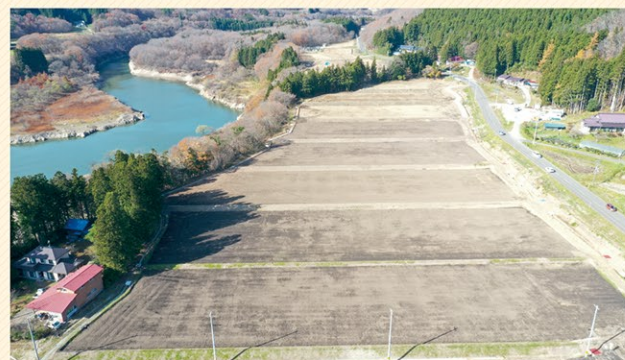
日向地区 整備事業後