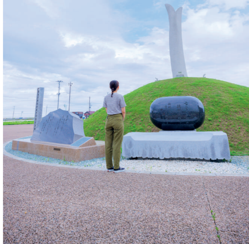
「芽生えの塔」は高さ8.4メートル。閑上地区における津波の高さを表しています。