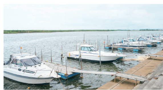
朝市から出港するゆりあげ周遊船クルーズ(7月~10月頃運航)やシーカヤック体験(不定期)もあります(有料)。詳細はHPをご確認ください。