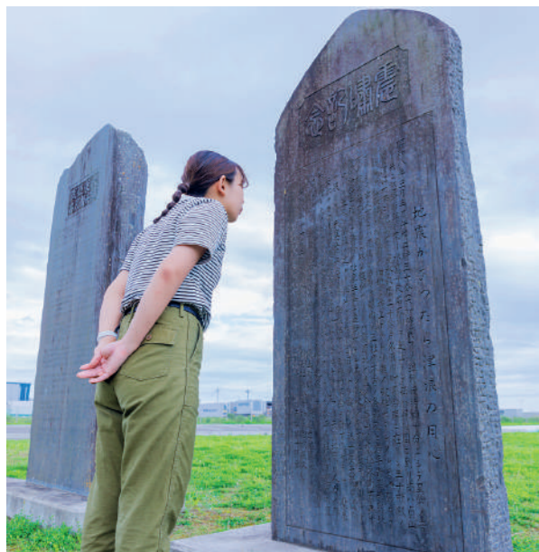
東日本大震災後、倒れていた石碑に昭和8年3月3日に発生した昭和三陸津波の被害と「地震があったら津波の用心」という教訓が記されていた。

問 園内には1933年の三陸地震津波の震嘯記念碑があります。この碑について震災復興伝承館で調べてみましょう。