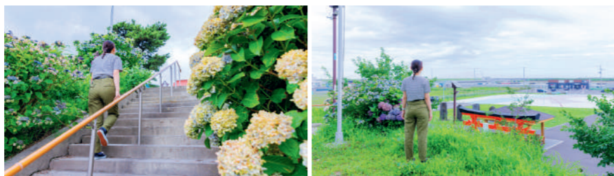
閑上地区一帯を見渡せる日和山。震災直後から人々が鎮魂のために訪れました。

「祈り」憩い「海を臨む」「日和山」「遺構と伝承」のゾーンから成る広大な空間。震災前は住宅や商店、水産加工場が立ち並んでいました。1920年に海上の様子を見るため築かれた日和山に登れば、公園はもちろん閑上一帯を見渡すことができます。 祈りの広場中央の慰霊碑は、「種の慰霊碑」から発芽した「芽生えの塔」が上へ上へと伸びる姿を象徴。犠牲となった方たちが天に昇っていくイメージであるとともに、市民の復興への強い決意が込められています。