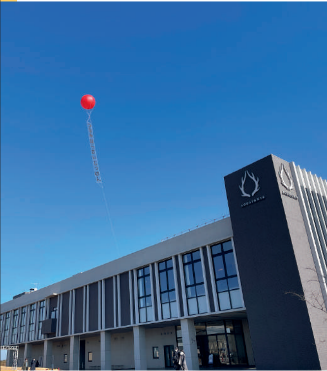
2023年2月に行ったアドバルーンの実証実験。アドバルーンの専門業者に依頼し制作した塩化ビニール製のもの。