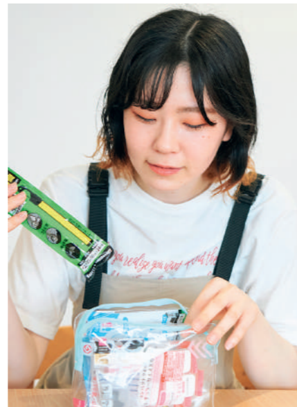
「人が溢れかえる避難所を想像すると、耳栓、簡易トイレはマスト。体を冷やさないようにブランケットも入れました。」