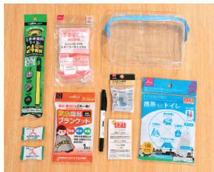
ポーヤンの防災ポーチ。 油性マジック/簡易トイレ/耳栓/コンパクトタオル/ 簡易ブランケット/災害用伝言ダイヤルガイド/災害備 蓄用ライト/鉛2つ