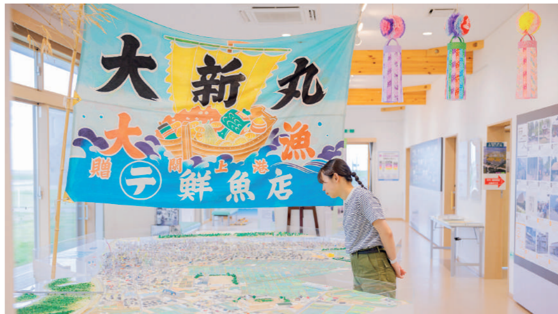
ジオラマは道路や家並みを精緻に再現。大漁旗は港町である閑上を象徴します。