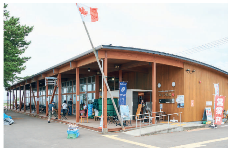
「メイプル館」。朝市のない日も営業しています(10時~16時・木曜日)。