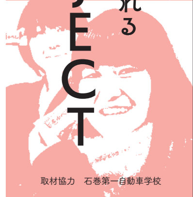
取材協力 石巻第一自動車学校