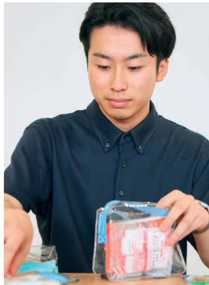
「避難所の混雑した中でも、自分の物やプライバシーをなるべく守れるようにしたいです。」