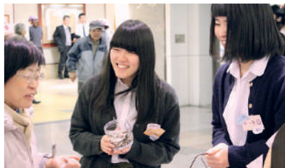
地元商品の魅力を発信する「高校生百貨店」。接客の訓練も受け、お客様とのやりとりを楽しみながら販売します。