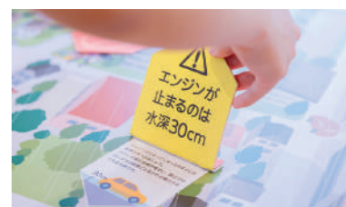
東日本大震災の教訓を、さまざまな災害への対応に当てはめ、学ぶことができるのがこの施設の特徴。

問 水深30センチの水圧を知っていますか？ ドアの開け閉めや靴を履いた歩行の疑似体験をして、行動がどう制限されるか実感しましょう。