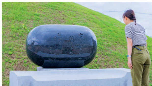
「亡き人を悼み 故郷を想う 故郷を愛する御霊よ 安らかに」と刻まれた「種の慰霊碑」