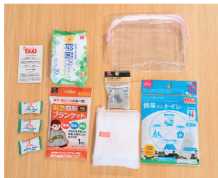
ほのりんの防災ポーチ。 除菌シート/簡易トイレ/耳栓/生理用ナプキン2個/ 簡易ブランケット/災害用伝言ダイヤルガイド/鉛3つ