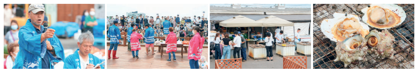
〈右2枚〉新鮮な魚介を買ってすぐアツアツを堪能。焼き方も教えてくれる「海鮮炉端焼き」。 〈左2枚〉地元の生鮮食品などが格安で買える「競り市」。活気にあふれ、リピーターも多数。