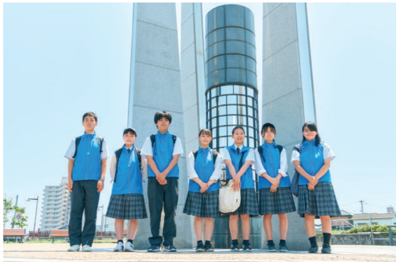
〈上〉「まち歩き」コースは震災伝承ネットワーク協議会の「3.11伝承ロード 震災伝承施設」に登録されています。〈下〉案内役を経験した生徒たちは、コミュニケーション能力や自主性が高まったと言います。

【問い合わせ】 宮城県多賀城高等学校 https://tagajo-hs.myswan.ed.jp/ 津波被災地まち歩きについて https://tagajo-hs.myswan.ed.jp/machiaruki