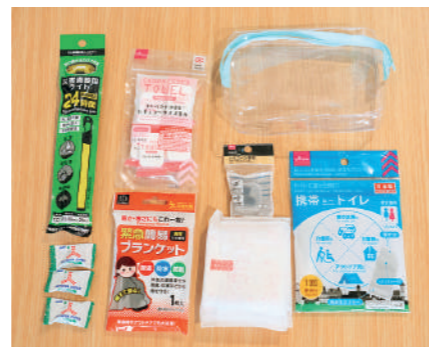
おすずの防災ポーチ。 簡易トイレ/耳栓/生理用ナプキン2個/コンパクトタ オル/簡易ブランケット/災害備蓄用ライト/鉛3つ