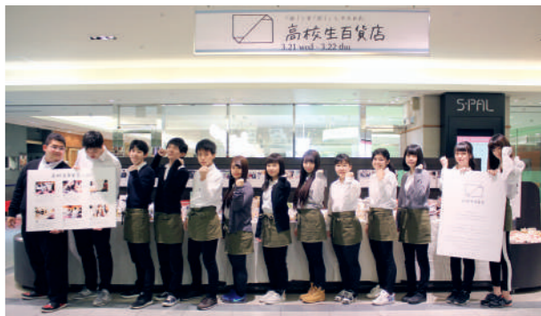
バイヤーも広報も高校生たちが担当。その楽しさと難しさを実感する機会になっています。