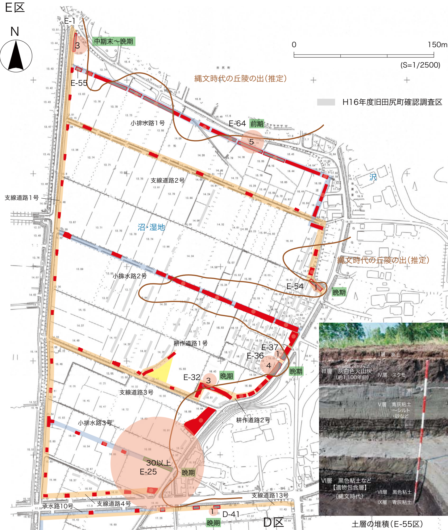
第2図 調査区の配置・遺物の分布と出土量