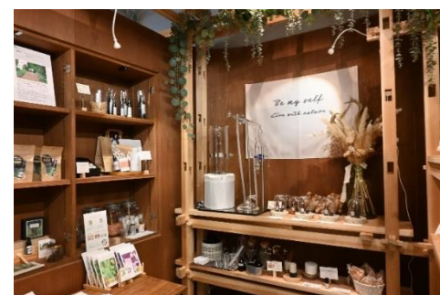
▲仙台市内の店舗。アロマ製品には地元の素材が使用されている。