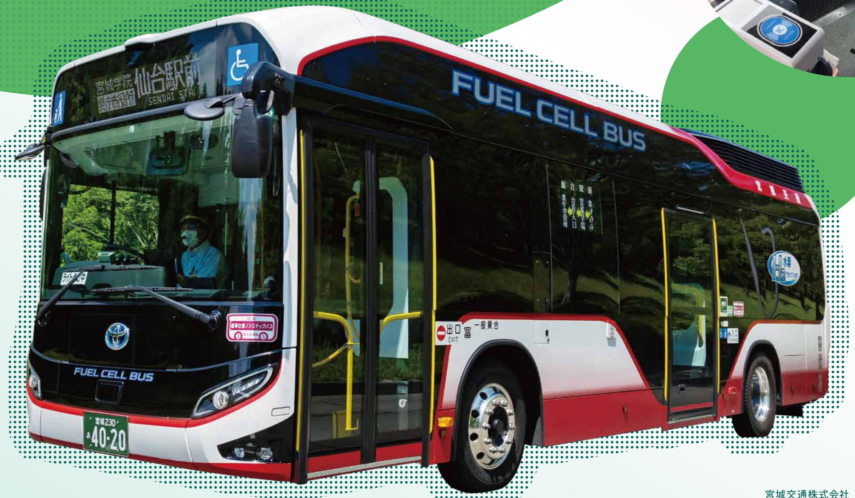
宮城交通株式会社

FCバスには電源供給能力が備わっています。そのため、バスとしての運行はもちろん、非常時の電力供給源としても期待されているんです。