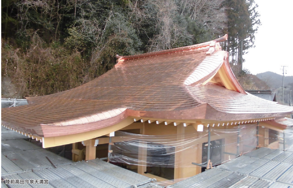
陸前高田今泉天満宮