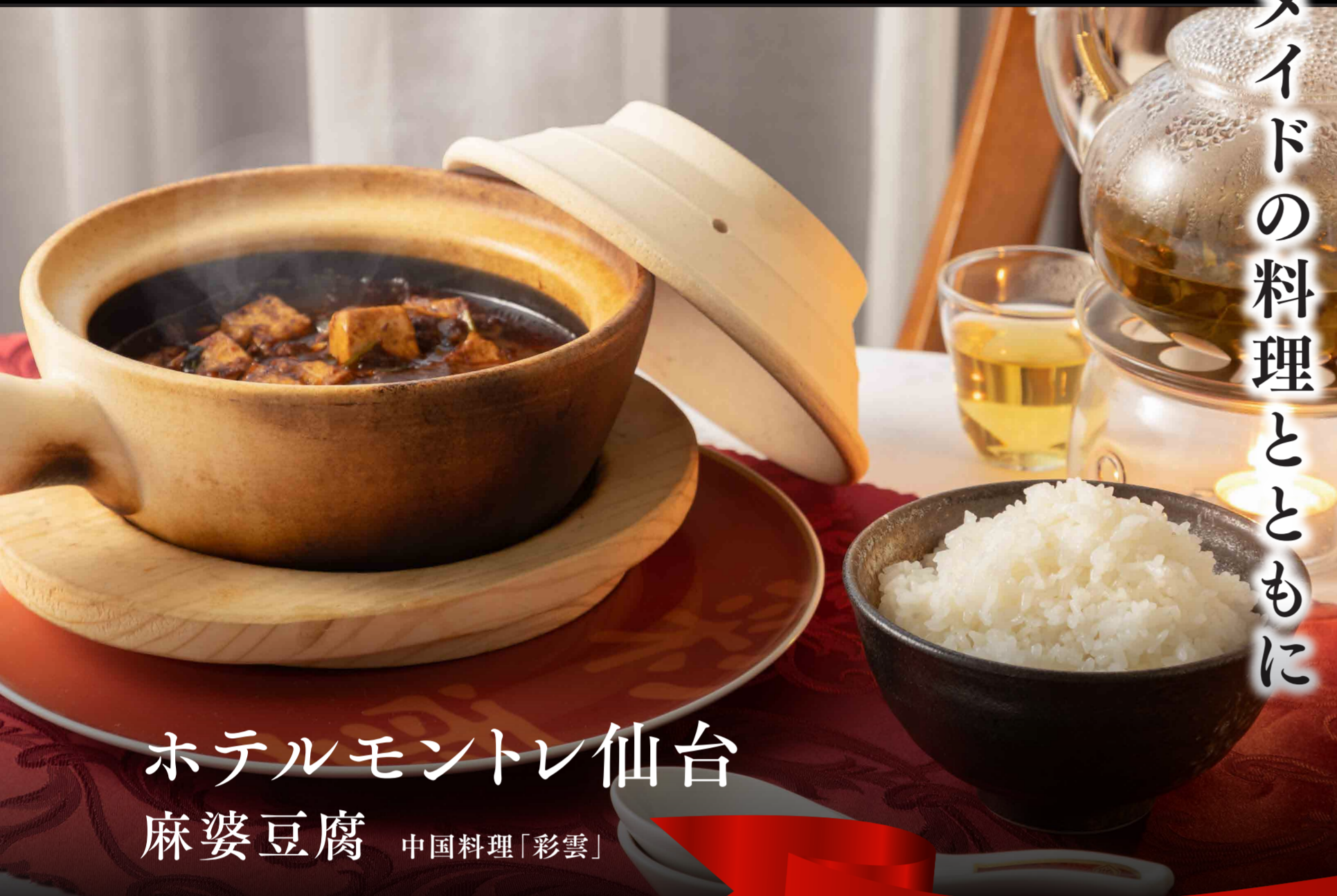
ホテルモンテレ仙台 麻婆豆腐 中国料理「彩雲」