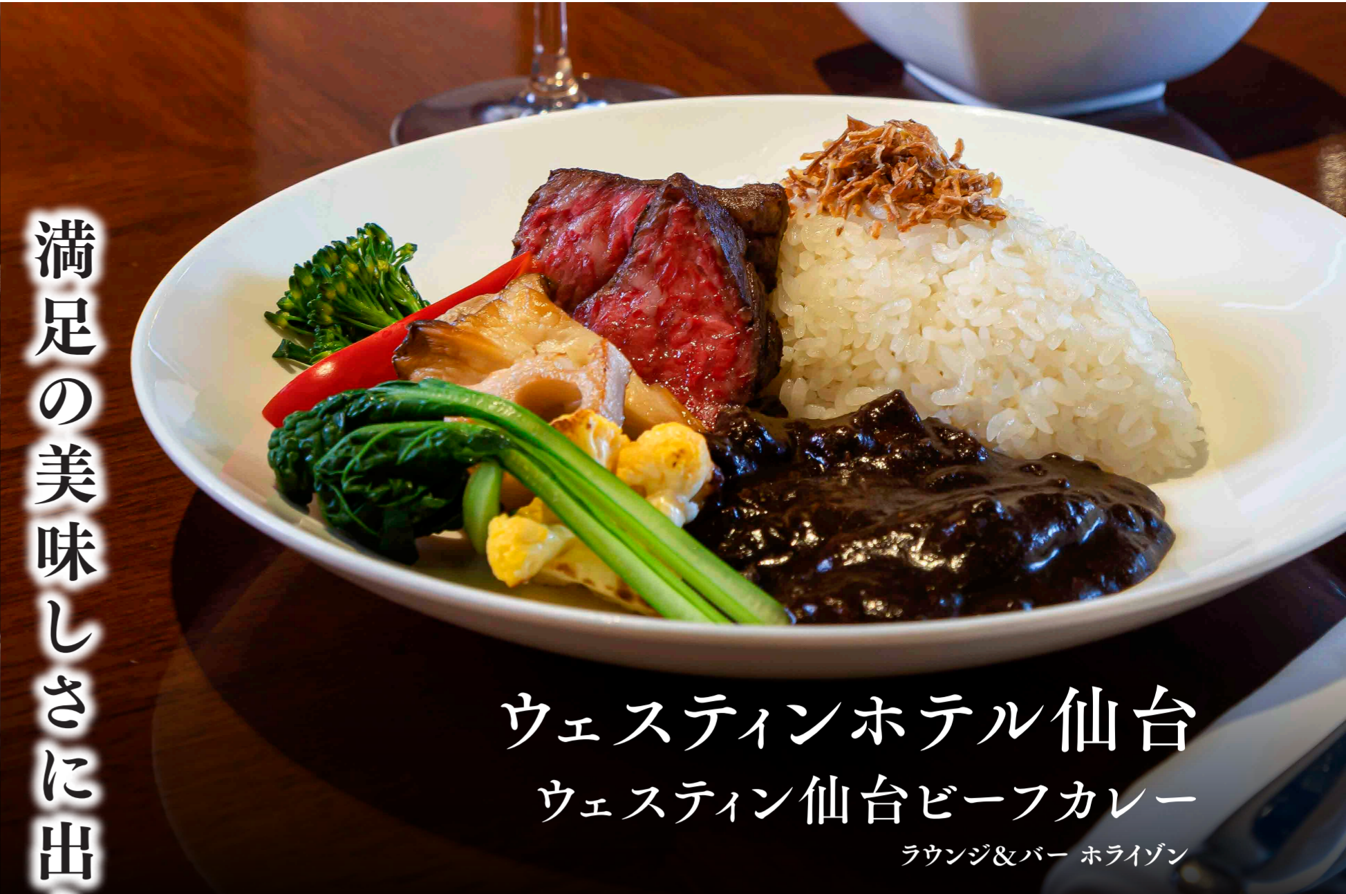
ウェスティンホテル仙台 ウェスティン仙台ビーフカレー ラウンジ&バー ホライゾン