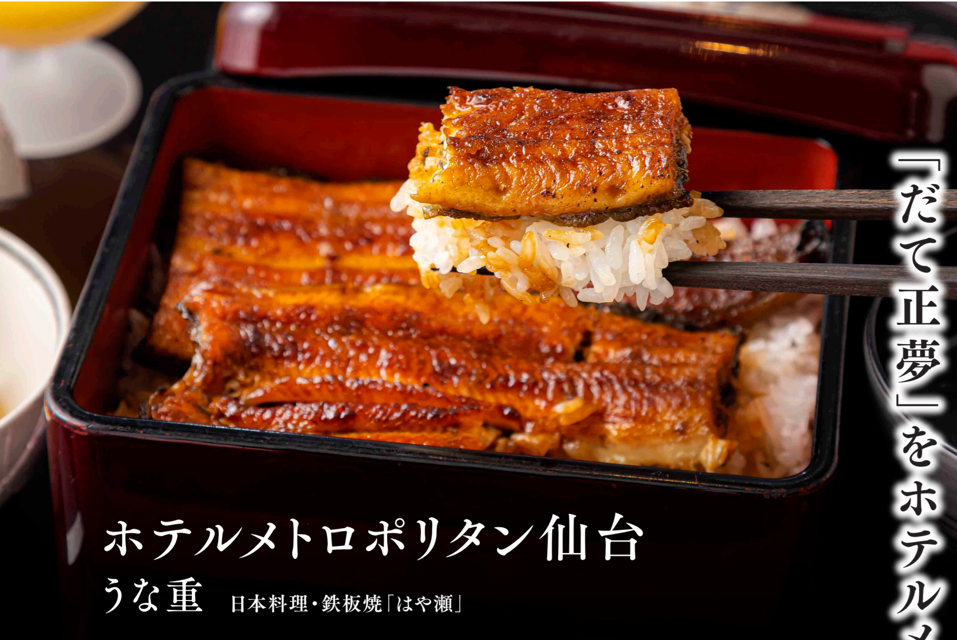
ホテルメトロポリタン仙台 うな重 日本料理・鉄板焼「はや瀬」