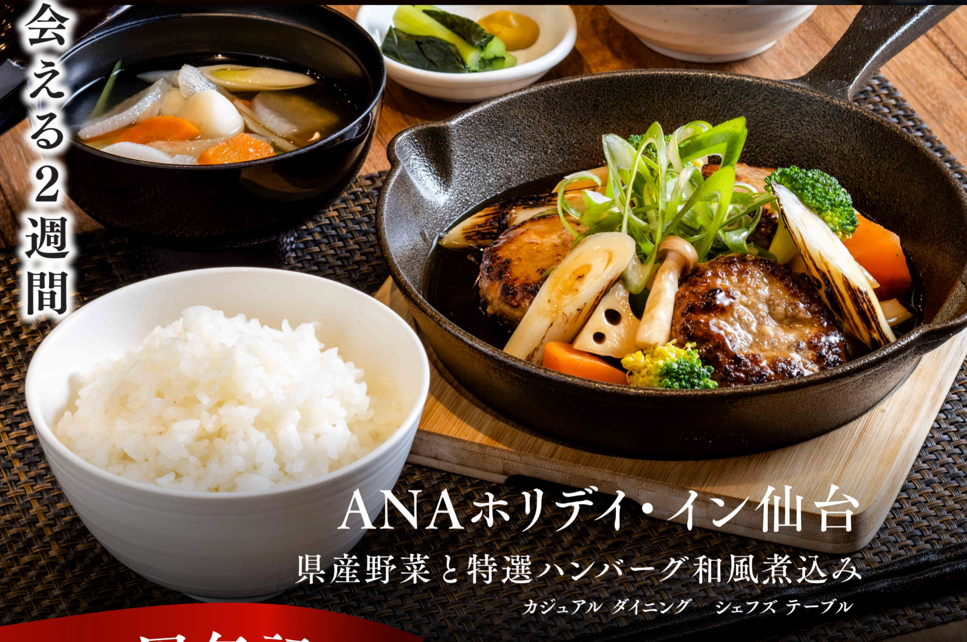
ANAホリデイ・イン仙台 県産野菜と特選ハンバーグ和風煮込み カジュアル ダイニング シェフズ テーブル