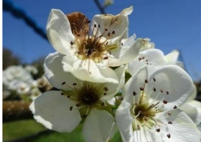
なしの雌しべの褐変