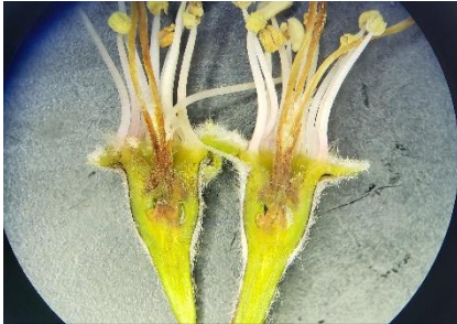
りんごの雌しべの褐変