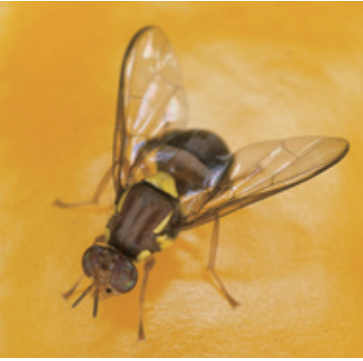
クインスランドミバエ