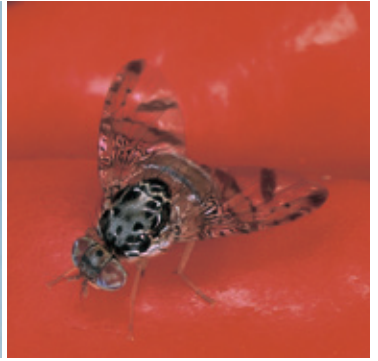
チチュウカイミバエ