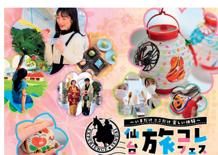
仙臺旅先体験コレクション フェスティバル2023