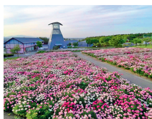
見事に咲くシャクヤクをバックに 写真撮影をどうぞ。

船形山をはじめとする奥羽山脈を見渡すことができます。色麻町産のエゴマの実を食べて育った「えごま豚」のロースかつ定食がおすすめとなっております。小さいお子さんも楽しめる豊富なメニューを取りそろえています。また、地元の新鮮野菜が購入できる農産物直売所も併設されています。皆さんのお越しをお待ちしています。