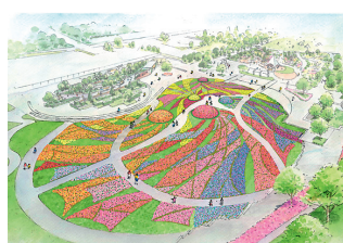
大花壇「はなばた飾り」 （イメージ）