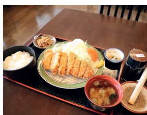
「えごま豚」のロースかつ定食。 ソースに、すりえごまを入れて お召し上がりください。