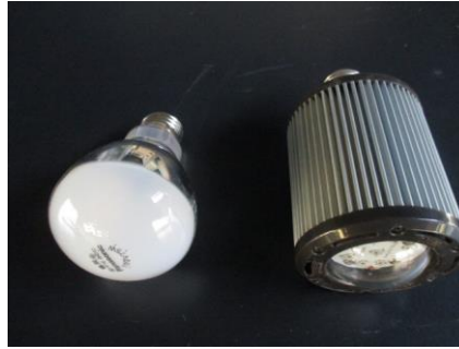
図1 各種光源の形状（左：白熱電球、右：赤色LED）