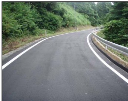
県道馬籠志津川線(南三陸町弘川地内)