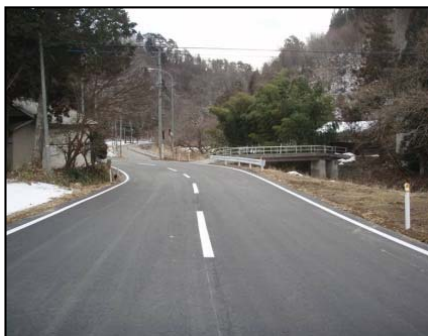
県道上八瀬気仙沼線(気仙沼市芳ノ口地内)