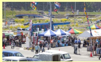
しろうお祭り状況。