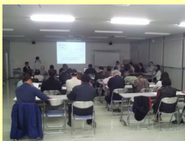
大島架橋大浦地区用地説明会 ・地権者等、20名が出席(約8割の方)