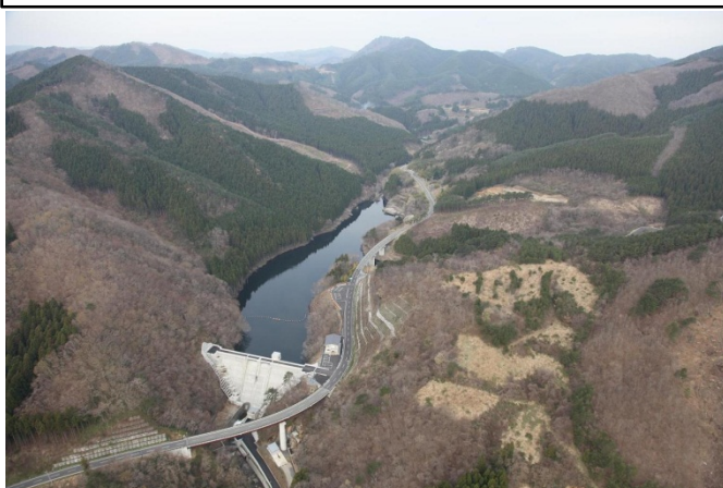
満杯の水を貯める“田束湖”(ダム湖) たつがねこ