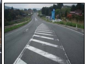
国道284号(気仙沼市川崎尻地内)