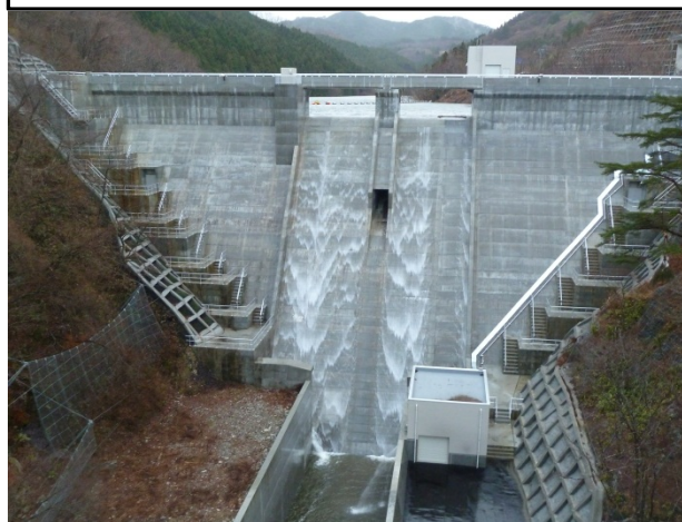
試験湛水実施中(最高水位到達時)