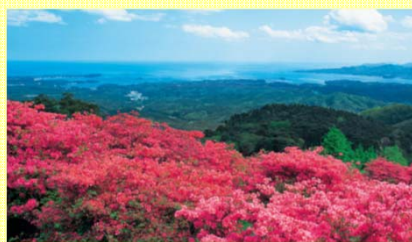
田東山頂上からは、太平洋が一望でき、満開のつつじが咲き誇ります。