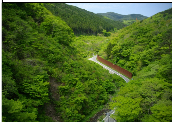
着工前の払川ダム位置