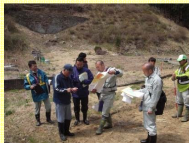
東舞根地区用地境界立会 ・地権者等、50名が立会(約9割の方)