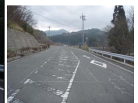
県道気仙沼本吉線(気仙沼市迎前田地内)