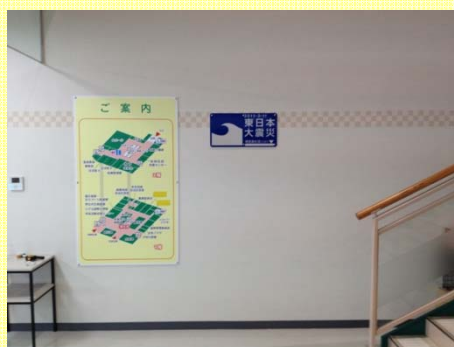
気仙沼市庁舎設置状況 (ワン・テン庁舎)