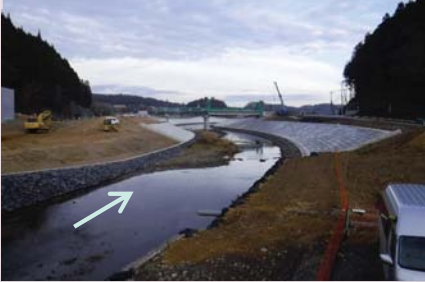
桜川 (南三陸町志津川字松井田地内外)