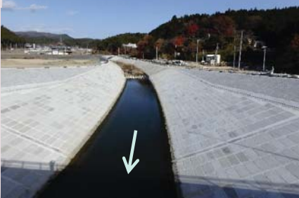
八幡川 (南三陸町志津川字汐見町地内)