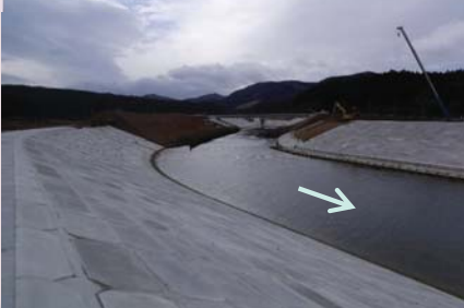
長清水川 (南三陸町戸倉字長清水地内)