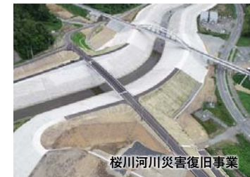
桜川河川災害復旧事業

東日本大震災で被災した桜川の災害復旧事業として、河川と県道・町道の整備を一体的に行いました。河川堤防はL1津波対応の堤防となっており、事業延長719.1m、復旧高さTP+8.7m～5.7m、県道は復旧延長430mを整備しました。令和元年7月16日に工事が完成し、7月31日に県道の交通開放を行いました。桜川河川災害復旧事業は完了しましたが、引き続き隣接する南三陸町施工の清水漁港災害復旧事業が行われています。