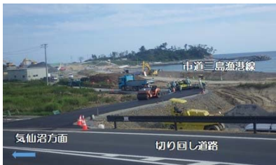
気仙沼方面 切り直し道路

平成30年1月20日に着工式典を行った大谷地区海岸の海岸防潮堤工事の進捗状況について、令和元年7月18日に国道45号の切回し道路の供用を開始しました。現在は国道45号の嵩上げ及び防潮堤建設のための既設構造物の撤去工事を行っています。通行される皆様には御不便・御迷惑をおかけいたしますが、引き続き御協力をお願いいたします。