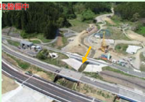
港川 (南三陸町歌津字港地内) 国道周辺を復旧中