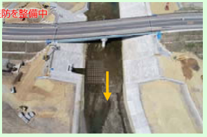
水尻川 (南三陸町志津川字大久保地内) 河川堤防を整備中