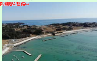
長須賀地区海岸 (南三陸町歌津字大沼地先) 海岸防潮堤を整備中