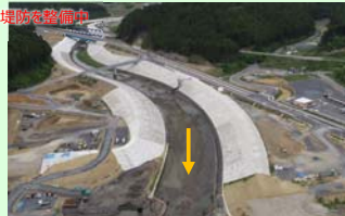
伊里前川 (南三陸町歌津字伊里前地内) 河川堤防を整備中