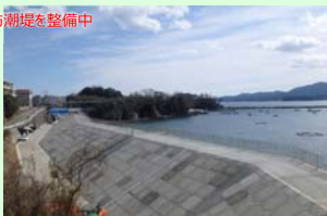
荒砥地区海岸 (南三陸町志津川字蒲の沢地内) 海岸防潮堤を整備中