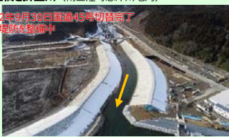
折立橋と折立川 (南三陸町志津川地内) 令和2年9月30日国道45号切替完了 河川堤防を整備中