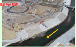
八幡川 (南三陸町志津川字汐見町地内) 河川堤防を整備中