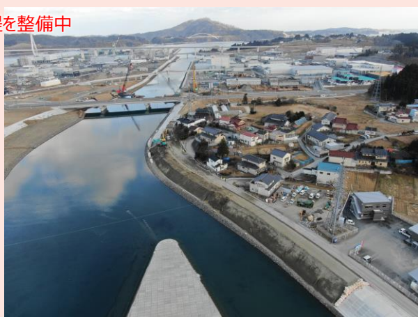
港川（南三陸町歌津字港地内）