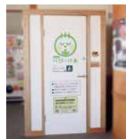
松島海岸レストハウス(松島町)