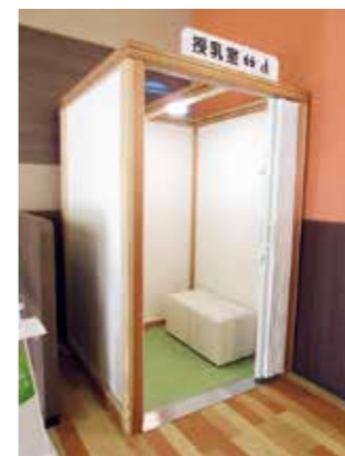
ヨークベニマル石巻蛇田店(石巻市)