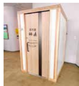
蔵王山頂レストハウス(七ヶ宿町)