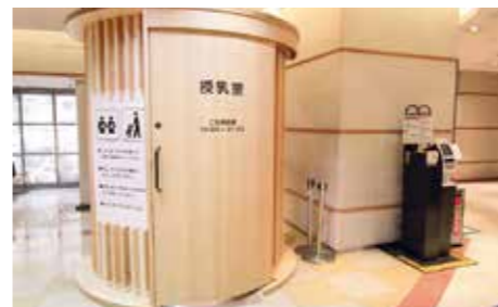
エスパル仙台(仙台市青葉区)