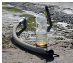
地下水を汲み上げるポンプ。海岸からほど近く、海抜が低いので、ミネラルを含んだ豊富な地下水が芝生の成長を促しています。

芝生の生産がスタートしたのは平成24年4月。惨状を見たときは涙も出なかった。でも1年たって何かしようと思って、ミネラルを必要とする芝生だったら、と思って、種をまいたんです。そ