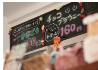
(上)笑顔で接客をする施設スタッフ。ほっこりとした癒しの空間になっています。 (左)車いすでも利用しやすいようスロープを設けるなどの工夫も。 (右)クッキーやケーキなどの焼き菓子は毎日手作りでしています。