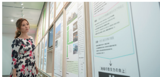
1Fのロビーでは、震災時の状況と市街地が完成するまでの様子などが展示されています。

ティーナさんは大阪出身。仙台の音楽事務所に所属するため、平成24年3月に引っ越してきました。不安がなかったかつて、よく聞かれるんですけど、私には希望の土地のように見えました。そこから5年活動して、いろいろな人と出会えば出会うほど、ここに来る意味があったなと思うんです。ご縁は間違ってたなかつたって。