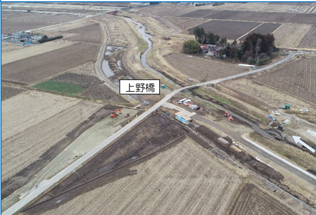
②名蓋川河川災害復旧附带工事（上野橋下部工）