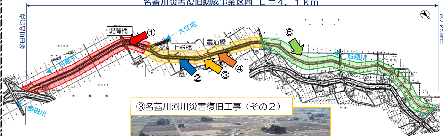
③名蓋川河川災害復旧工事（その2）