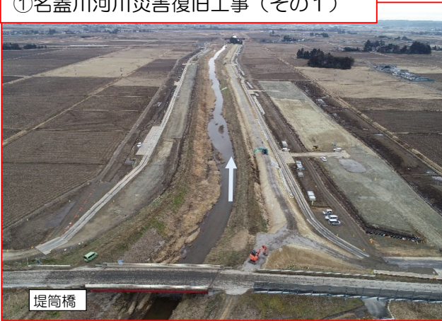
①名蓋川河川災害復旧工事（その1）