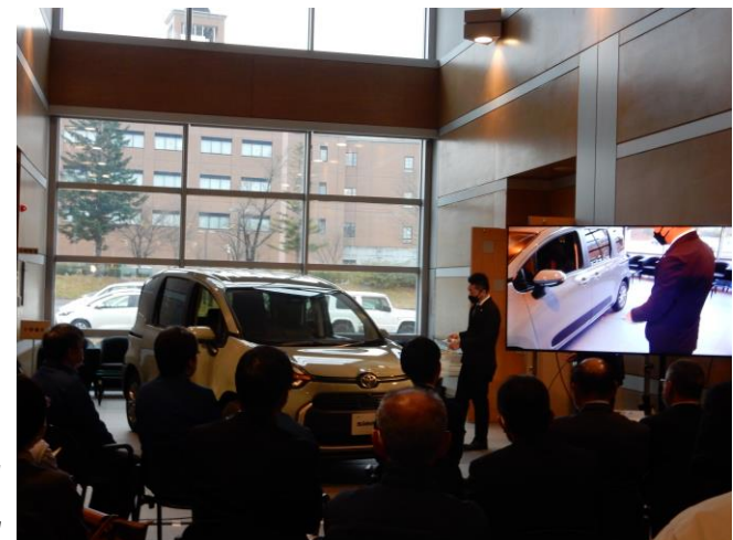
自動車関連産業セミナー(第2回)