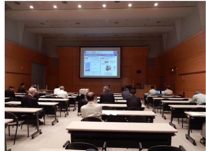
自動車関連産業セミナー(第1回)