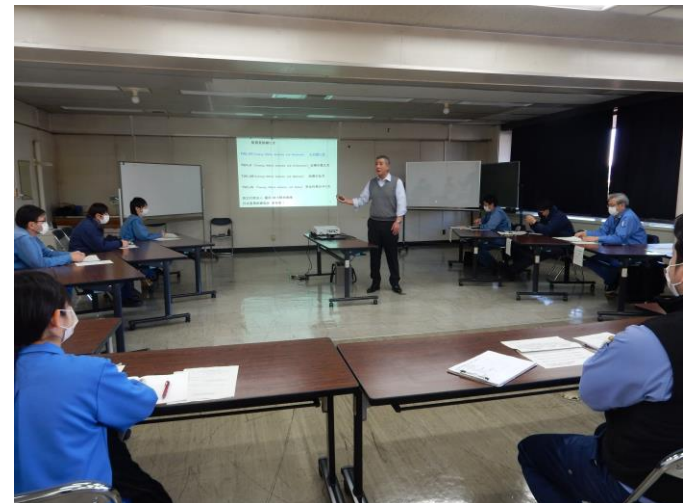
令和4年度 生産改善着眼点養成研修