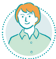
出身校：東陵高校 入社2年目

車でご来店されるお客様との会話の中から、お客様が困っている事に自分がしっかり対応できて、お客様の期待を越えられた時、直接感謝の言葉をいただくと本当に嬉しいです。その喜びが自分をさらに成長させてくれて、これが接客業の醍醐味だと思います。お客様に顔と名前を覚えていただき、雑談で笑いも交えて会話が出来ようになれば、仕事以外の色々な事も教えていただけるようになり、世界が広がるのも楽しいです。