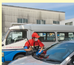
新入社員研修にて社会人としての基本を身につける。