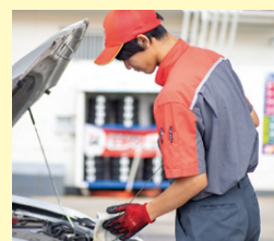
基本的な商品知識・取扱スキルを身に付け、接客対応が出来る。